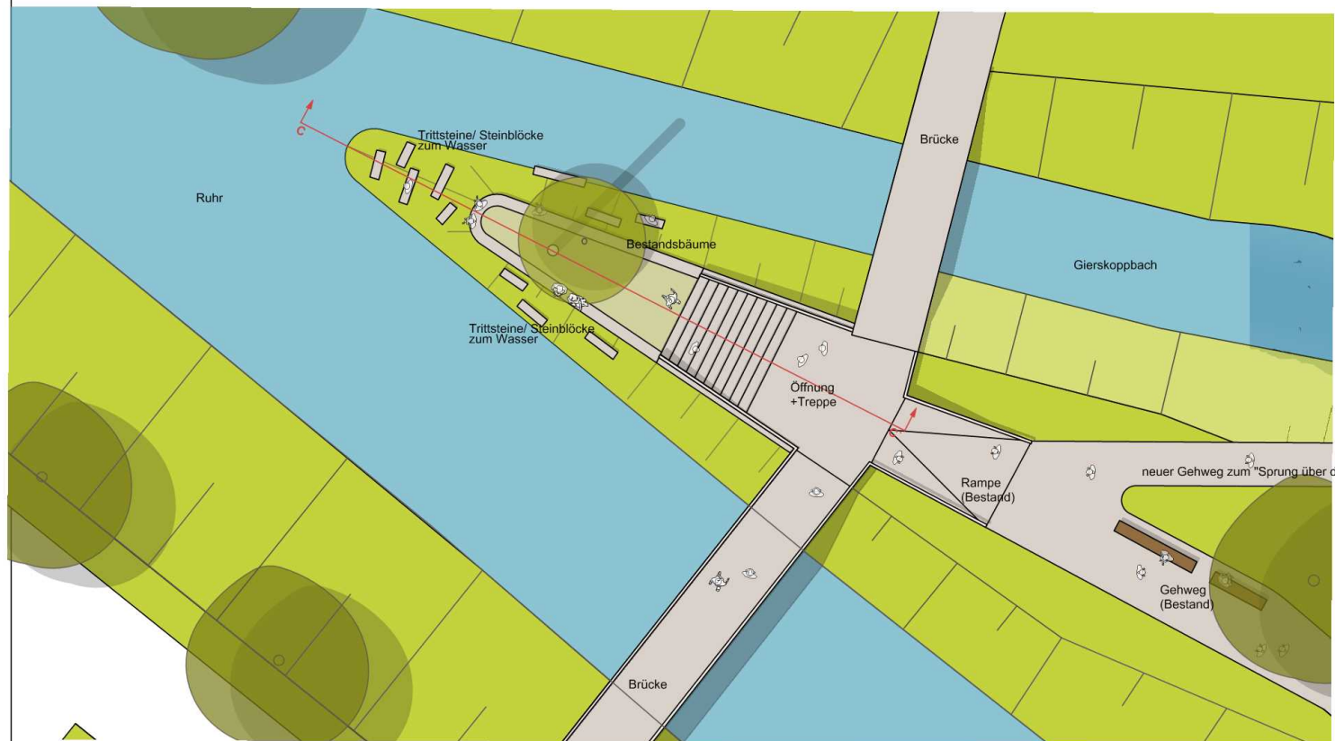
Schnittverortung, Lageplanausschnitt, "OlsbergEck" - Station 4 M 1:100